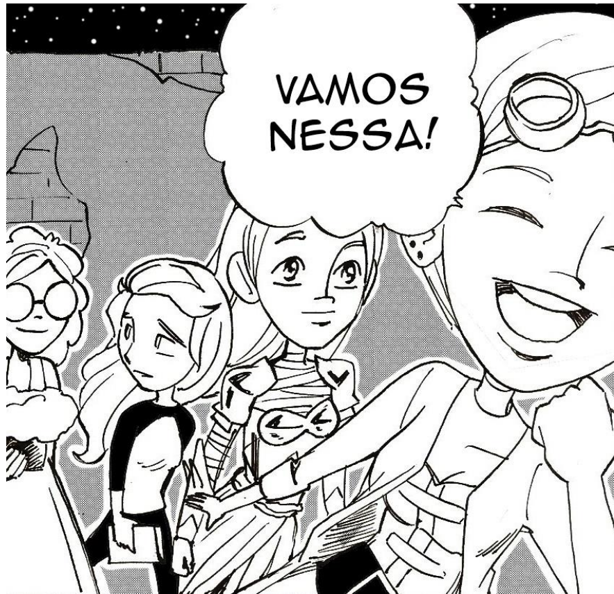
Comic Book Commando