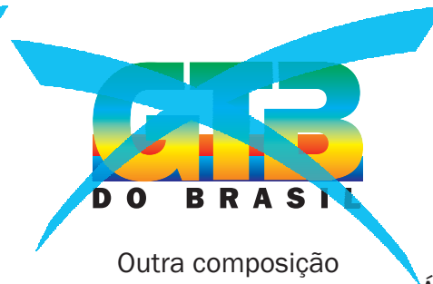
Outra composição de cor