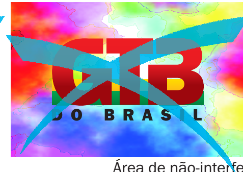
Área de não-interferência desrespeitada