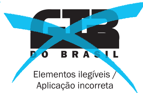
Elementos ilegíveis / Aplicação incorreta