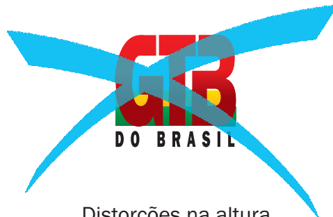
Distorções na altura