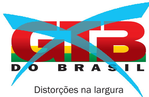
Distorções na largura

As seguintes reproduções não são permitidas.