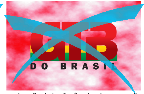
Área de não-interferência desrespeitada