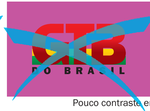
Pouco contraste entre fundo e logotipo