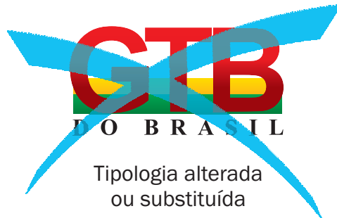
Tipologia alterada ou substituída